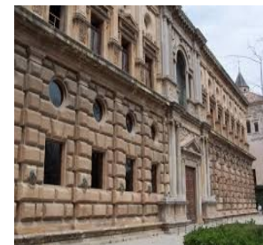
Palacio de Carlos V

2. Etapa purista. A partir del reinado de Carlos V los edificios renacentistas entran en una etapa con gustos más clásicos, disminuyendo la decoración plateresca y limitándose a los elementos arquitectónicos.