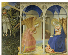
La Anunciación (Fra Angélico)