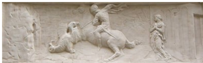
Técnica del Stacciato en la piedra de la base del San Jorge de Donatello (1417)

El David (1440) es su obra más famosa. En esta escultura en bronce, Donatello crea por primera vez desde la antigüedad clásica un desnudo masculino, a la vez que logra liberar a la escultura del marco arquitectónico. Destaca sobre todo por la tranquilidad que transmite, todo lo contrario que el Condottiero Gattamelata (1453), que cuenta con un mayor dramatismo y carga expresiva.