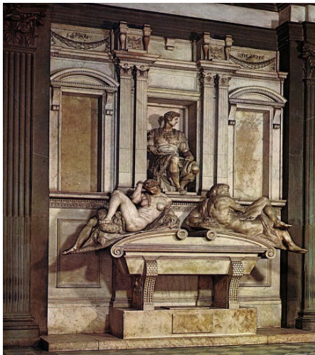
Sepulcro de los Médicis

El panorama escultórico durante el cinquecento está dominado por el genio creativo de Miguel Ángel . Belleza y expresividad, idealismo y rebeldía son los conceptos básicos para entender su arte. De ser uno de los forjadores del clasicismo, pasó a convertirse en símbolo del manierismo y del movimiento anticlásico. Sus primeras obras maestras fueron la Piedad del Vaticano y su célebre David , un excelente desnudo realizado en Florencia con el que revalorizará el canon clásico y el colosalismo, sin abandonar el retrato psicológico. Posteriormente en Roma realizará el Moisés que nos impresiona por su terribilitá . En Florencia trabaja en la Capilla de los Medici, donde realiza los sepulcros de Giuliano y Lorenzo . Sus últimas obras como La Piedad Florentina entran de lleno en el manierismo escultórico.