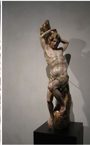
San Sebastián de Alonso de Berruguete