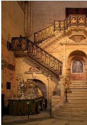
Escalera dorada de la Catedral de Burgos