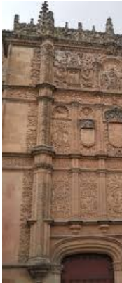
Fachada Universidad de Salamanca

edificios y elementos renacentistas, principalmente en la decoración de las fachadas (medallones, heráldicos, grutescos, candelabros, columnas abalaustradas...). En el denominado " estilo Cisneros " la mezcla se hará con elementos renacentistas y mudéjares. La obra maestra de este estilo es la fachada de la Universidad de Salamanca , realizada por Juan de Talavera. En Burgos destaca la escalera dorada de la Catedral de Diego de Siloé. Otra muestra del plateresco en Andalucía es la fachada del Ayuntamiento de Sevilla .