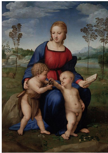
La Madonna del Jilguero (Rafael)