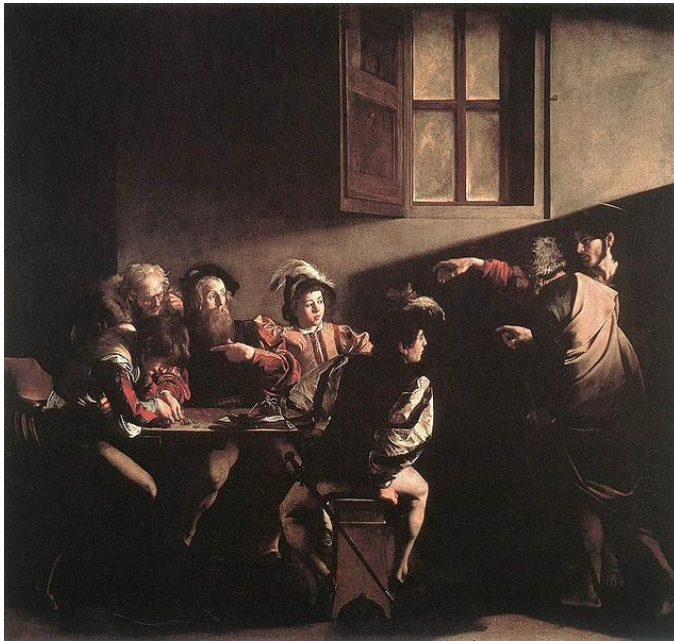
La vocación de San Mateo, una de las más perfectas muestras del Tenebrismo de Caravaggio. Estamos ante una nueva forma de tratar la luz

tema muy recurrente, aunque normalmente como alegorías de lo fugaz que es la vida terrenal.