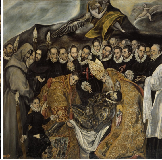
El entierro del Conde Orgaz

Pinta figuras humanas llenas de encanto y amabilidad dominando la técnica del Sfumato