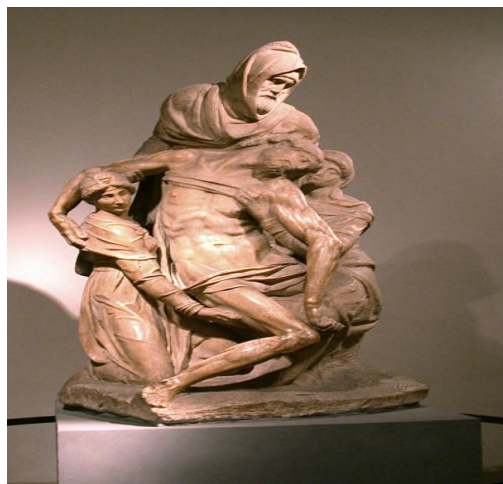
Piedad Florentina de Miguel Ángel

En Italia siempre estuvo presente la figura humana ya fuera la escultura religiosa o funeraria. En el trecento , el modelo cada vez es más parecido a la obra escultórica cuyas creaciones tenderán además al monumentalismo.