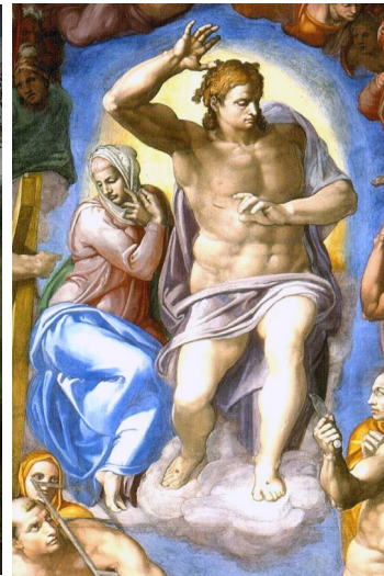
Detalle del Juicio Final de la Capilla Sixtina (Miguel Ángel)

En el siglo XVI, será Venecia quien centre el interés pictórico. Allí la pintura se caracterizará por el gusto por el color y por el paisaje, la representación de la riqueza y una temática normalmente idílica. Sus autores más representativos serán Tiziano que usará como nadie el aire, la luz y el color y el Veronés , el pintor del lujo, El manierismo pictórico se pone ya de manifiesto con artistas como Tintoretto con sus violentos juegos de luces y sombras y Giorgione que destaca por la riqueza cromática en sus obras.