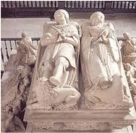
Sepulchro de Juana la Loca y Felipe el Hermoso de Barotolomé Ordóñez

del Santo Entierro de Juan de Juni donde destaca su dimensión trágica y la llamativa policromía de sus figuras.