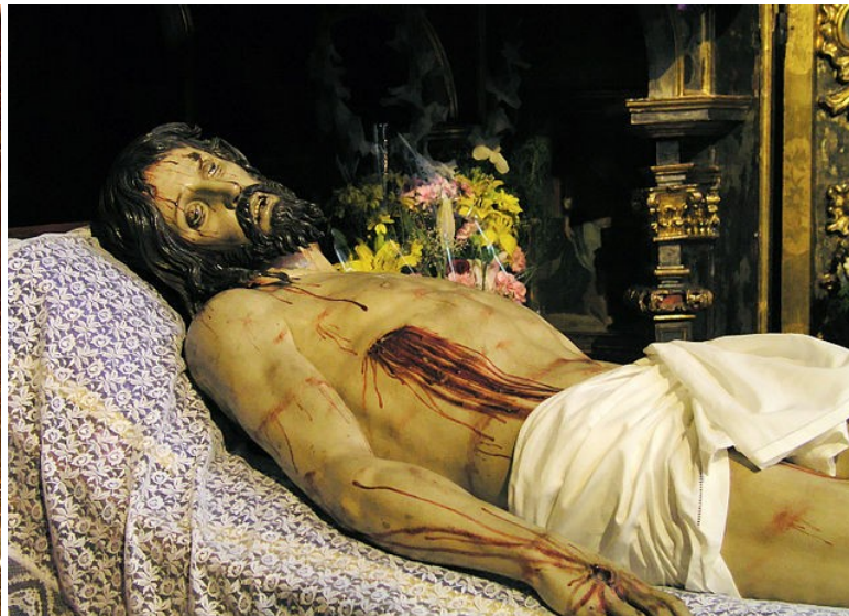
Cristo Yacente de Gregorio Fernández

¿Podrías decirnos a qué escuela escultórica de nuestro país pertenecen cada una de estas dos esculturas? Razona tu respuesta.