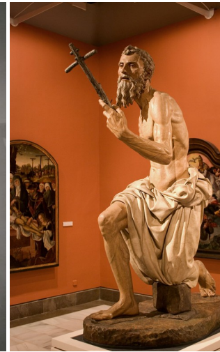
San Jerónimo de Torrigiano

La inspiración clásica de los escultores del renacimiento implica una copia o reproducción de los modelos