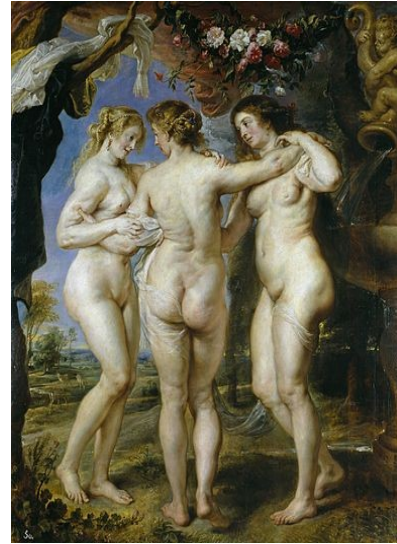
La obra de Rubens destaca por su vitalidad y dinamismo, como se puede observar en Las tres Gracias