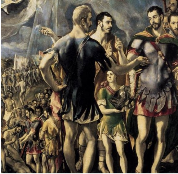
El martirio de San Mauricio