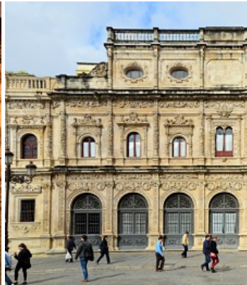
Fachada del Ayuntamiento de Sevilla

2. Etapa purista. A partir del reinado de Carlos V los edificios renacentistas entran en una etapa con gustos más clásicos, disminuyendo la decoración plateresca y limitándose a los elementos arquitectónicos.