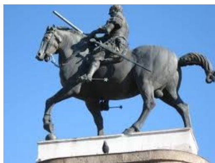
Condottiero Gattamelata (1453)