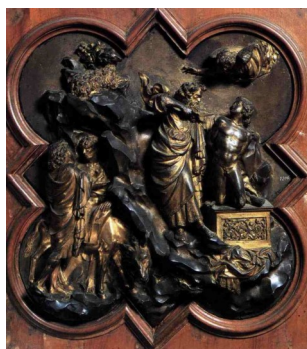
El Sacrificio de Isaac en la Puerta del Baptisterio de Florencia

El David (1440) es su obra más famosa. En esta escultura en bronce, Donatello crea por primera vez desde la antigüedad clásica un desnudo masculino, a la vez que logra liberar a la escultura del marco arquitectónico. Destaca sobre todo por la tranquilidad que transmite, todo lo contrario que el Condottiero Gattamelata (1453), que cuenta con un mayor dramatismo y carga expresiva.