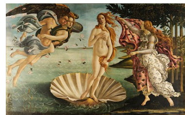
El nacimiento de Venus (Boticelli)