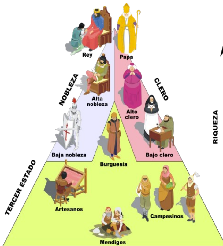
LA SOCIEDAD ESTAMENTAL

Estos eran los principales escenarios de la vida cotidiana de estos grupos.